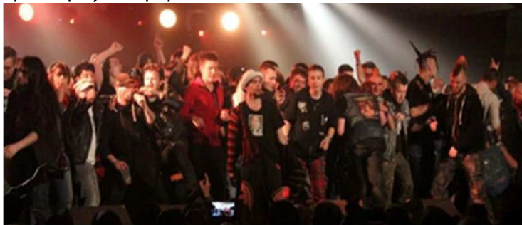
Le public ravi et survolté.

J'ai pu interviewer plusieurs festivaliers particulièrement intéressants par leur tenue, sans aucun souci et ils se sont prêtés gentiment aux questions réponses que je leur proposais.